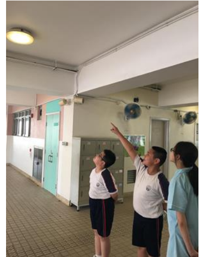
老師跟本校環保大使講解環保燈的效用