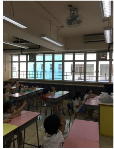
老師跟幼稚園學生講解環保燈的效用