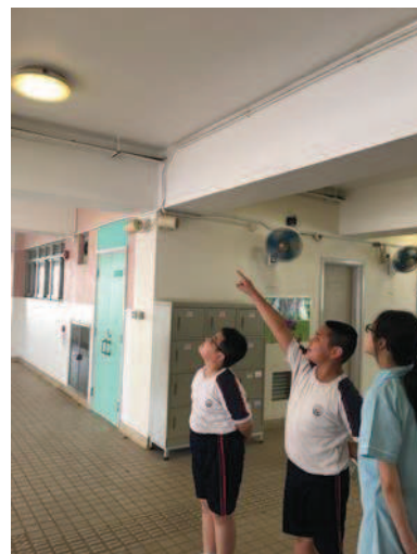
老師跟本校環保大使講解環保燈的效用