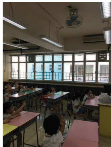
老師跟幼稚園學生講解環保燈的效用